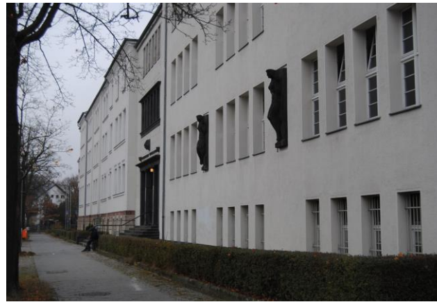
LAGE / VERKEHRSVERBINDUNGEN